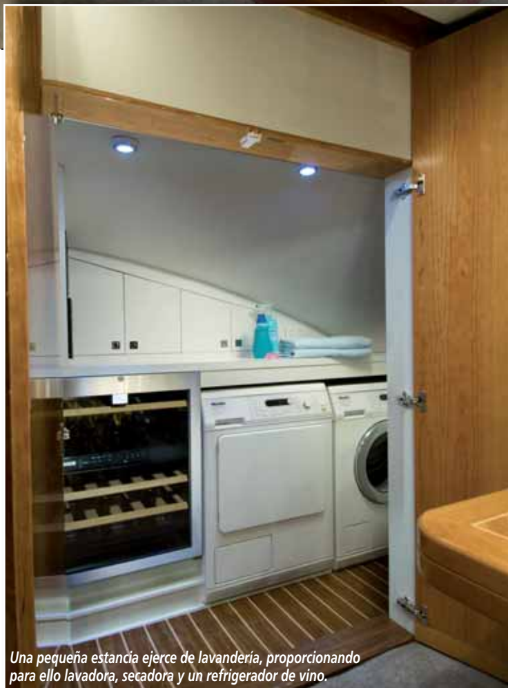
Una pequeña estancia ejerce de lavandería, proporcionando para ello lavadora, secadora y un refrigerador de vino.

Otra de las cabinas se ha situado en proa, permitiendo equiparla con una cama de matrimonio con estiba en su interior o con cuatro camas individuales dispuestas en dos literas. Ésta cuenta con armarios colgadores, además de con su propio cuarto de aseo. Completan el espacio de pernocta dos camarotes más, uno en babor con camas gemelas y una tercera extra plegable, y otro en estribor, que puede equiparse tanto con una cama doble como con dos individuales con otra individual plegable. Ambos cuentan, cómo no, con sendos baños privados con ducha separada. ■ H.G.