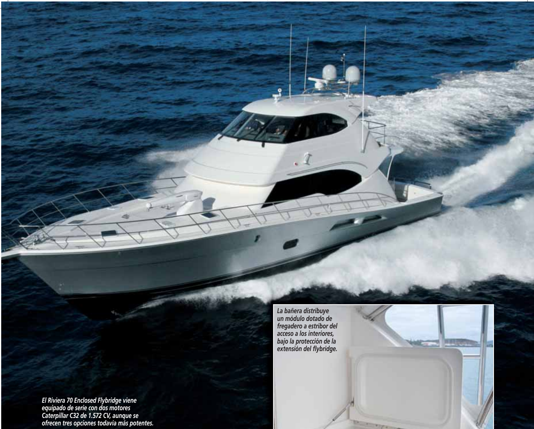
El Riviera 70 Enclosed Flybridge viene equipado de serie con dos motores Caterpillar C32 de 1.572 CV, aunque se ofrecen tres opciones todavía más potentes.