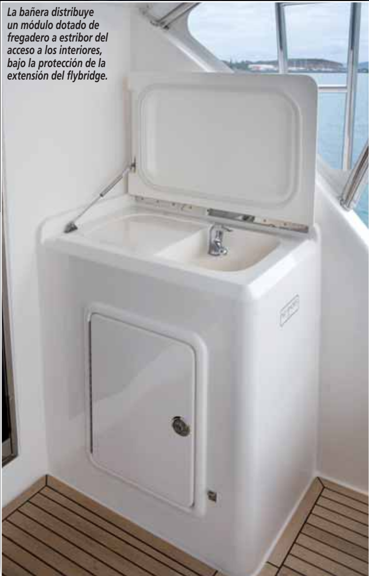
La bañera distribuye un módulo dotado de fregadero a estribor del acceso a los interiores, bajo la protección de la extensión del flybridge.

ten ampliar esta potencia con tres propuestas que permiten equipar el crucero hasta con una doble unidad de 1.823 CV.