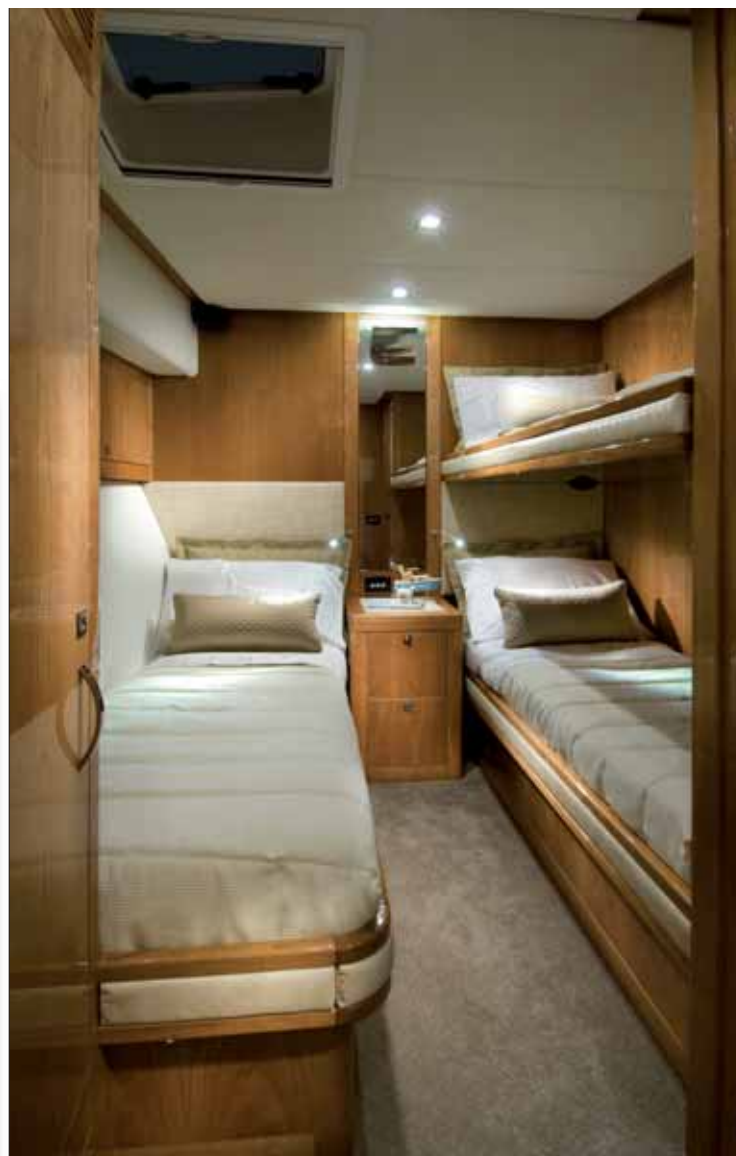
▲ Otra cabina en babor ofrece alojamiento para tres personas en tres camas individuales, una de ellas plegable.