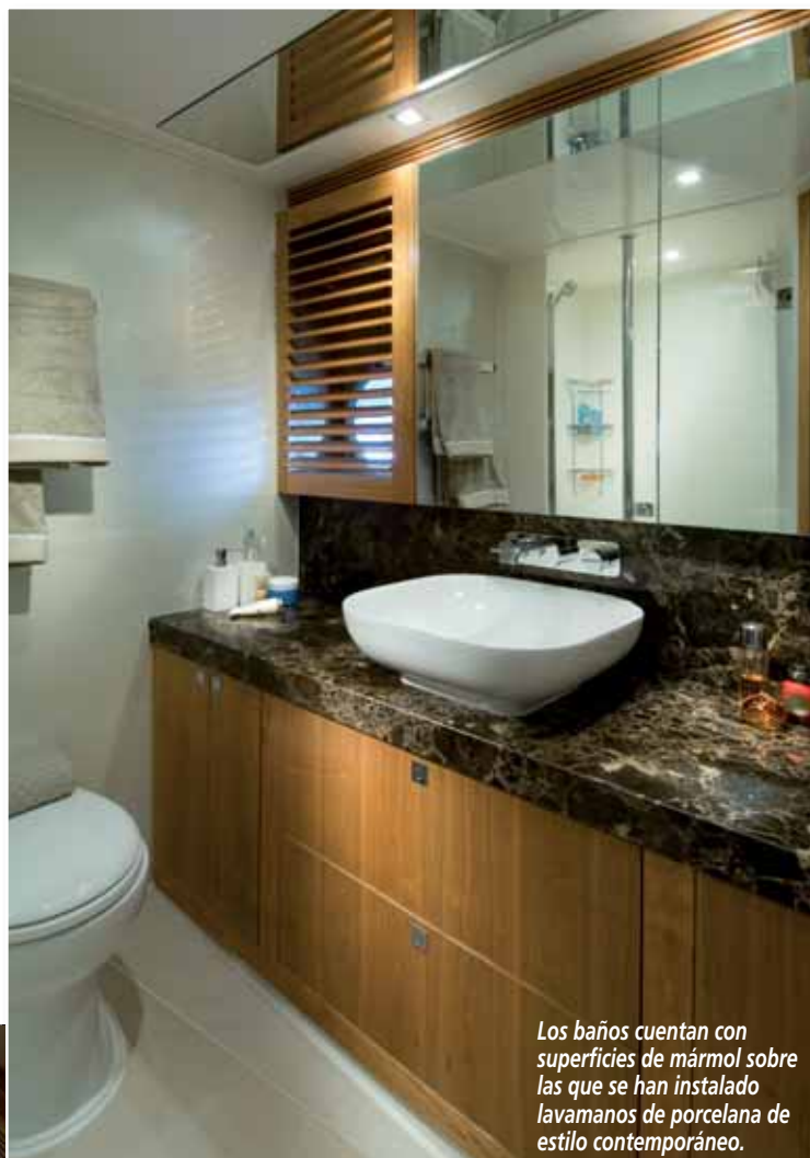
Los baños cuentan con superficies de mármol sobre las que se han instalado lavamanos de porcelana de estilo contemporáneo.

●●● El alojamiento, compuesto por cuatro camarotes, se concentra en el piso inferior. EL DEL ARMADOR OCUPA LA SECCIÓN CENTRAL, CON LO QUE DISFRUTA DE LA MANGA ENTERA para proporcionar un ambiente espacioso y elegante