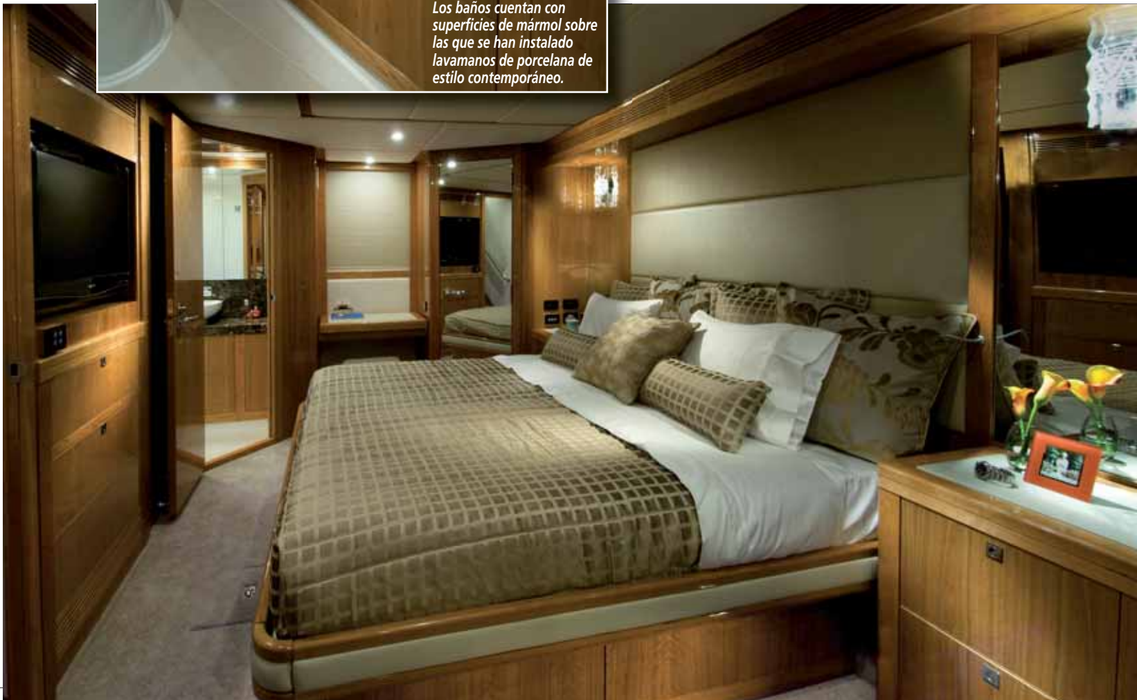
El camarote del armador se extiende por la manga entera para ofrecer una generosa cama doble en isla. ▼